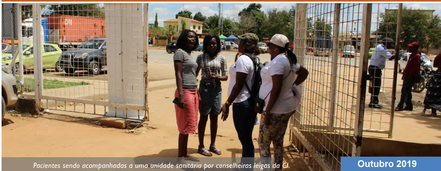
Pacientes sendo acompanhadas a uma unidade sanitária por conselheiras leigas da CI.