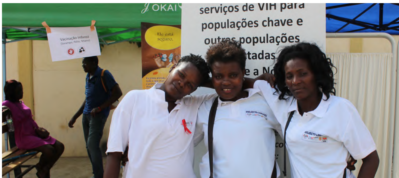
Feira de saúde no Hospital Cajueiros.