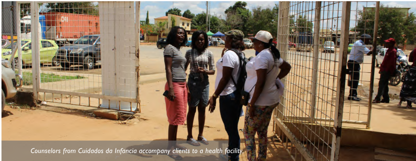
Counselors from Cuidados da Infância accompany clients to a health facility.

W hile civil society organizations in Angola have improved their ability to reach key populations (KPs) through the cascade of HIV prevention and testing services, they faced challenges linking those who test positive to care and treatment. The rate of initiation of antiretroviral treatment (ART) in the first seven months of the LINKAGES Project was only 19 percent (11/53).