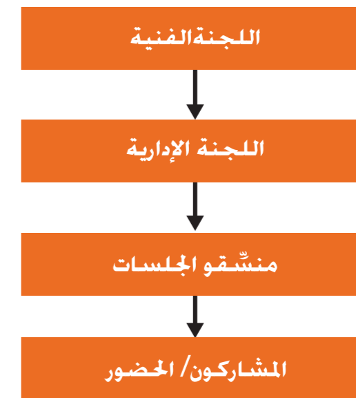
فريق عمل مجموعات الدعم