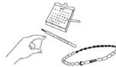
Méthodes de sensibilisation à la fertilité